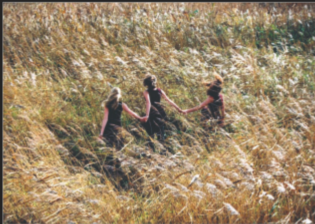
fol. Paweł Malarczyk