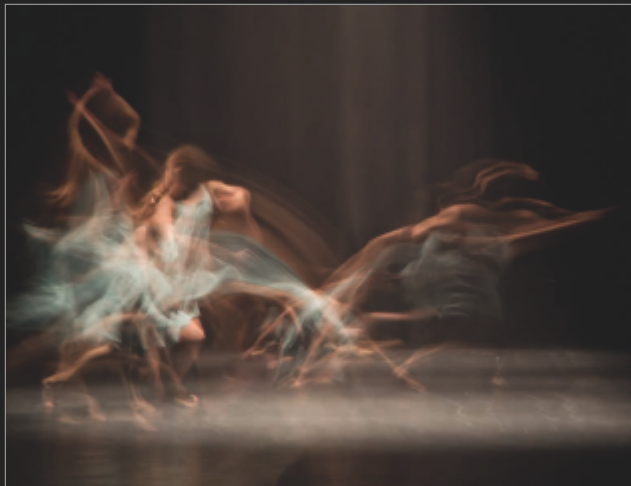
fot. Małgorzata Stój